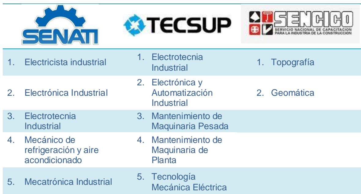
Cuadro N° 1. Listado de carreras elegibles según Institución de Educación Superior Tecnológica

FONDOEMPLEO ha identificado las carreras de mayor demanda para el sector minero. El Cuadro N° 1 presenta la relación de carreras consideradas elegibles para esta convocatoria.